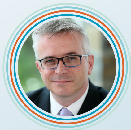
Alun Jones Prif Weithredwr

“Yn ystod y cyfnod hwn ar ôl y pandemig, rydym yn cydnabod yr heriau parhaus y mae gwasanaethau gofal iechyd yng Nghymru yn eu hwynebu ac mae ein nod o lywio gwelliannau ym maes gofal iechyd yn bwysicach nag erioed.”